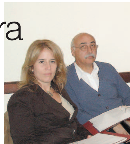
Directiva de Casemed

2) A partir del 1/9/2006, CASEMED se hace cargo de la afiliación